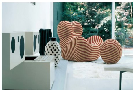
图7 盖塔诺·佩斯加/沙发

波普艺术对流行文化元素与符号的借用形式与创作理念,被当代设计师大量应用于艺术设计和文化创意领域。波普艺术通俗而简约的表达手法,很快被欧美设计师应用于各类平面与产品设计中。这一类设计贴近大众的喜好和流行趣味,进而使设计具有了亲民的特质。这类设计采用简洁的造型、平面化的色彩,打破了传统设计风格的羁绊,迅速得到追求时尚的年轻人的追捧。例如,盖塔诺·佩斯加设计的沙发(图7)和穆多什设计的儿童椅(图8),其设计手法与表现性均明显具有波普艺术的特征,表达出强烈的反叛主张。在服装设计领域,设计师借鉴具有鲜明现代气息的波普艺术开辟出令人耳目一新的设计之路,或者将波普绘画艺术中的图案直接再现于设计的服装上。我们不难发现,设计师的设计理念通过波普元素,以大众化的语言表现于时装、家具、音乐媒介等流行文化与生活用品。风格各异的产品造型设计、独特的图形装饰与图案设计、不守常规的设计概念等纷纷涌现 [3] 。