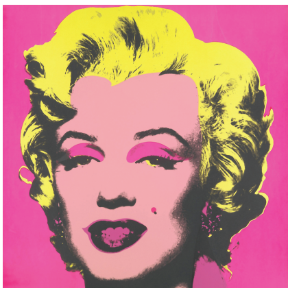
图3 安迪·沃霍尔/玛丽莲·梦露

边界的一次艺术实践。安迪·沃霍尔画标志性的美钞、蘑菇云、电动座椅等,画名人肖像如猫王、马龙·白兰度、穆罕默德·阿里、伊丽莎白·泰勒等,他最著名的作品包括《坎贝尔的汤罐头》(图2)、《玛丽莲·梦露》(图3)、《地下丝绒乐队专辑封面》(图4)等。在作品《玛丽莲·梦露》中,他以好莱坞性感影星梦露的头像作为画面的基本元素,一排排地重复排立。一个个色彩简单、整齐单调的梦露头像,反映出现代商业化社会中人们无可奈何的空虚与迷惘。