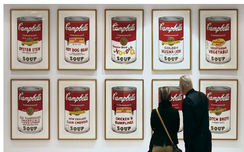
图2 安迪·沃霍尔/坎贝尔汤罐头

波普艺术通常采用大众传媒中使用的影像,如在美国波普艺术家安迪·沃霍尔的作品《坎贝尔汤罐头》中(图2),产品的大众化特征和普识性标志符号显得尤为突出,食品盒子的标签都成为了波普艺术的主题。