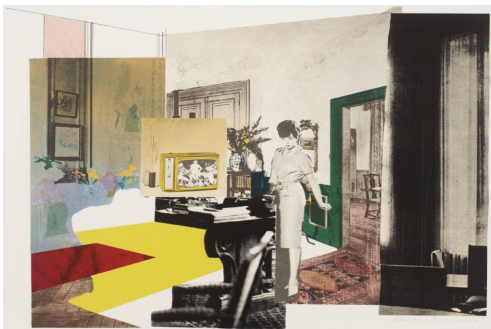
图1 理查德·汉密尔顿/室内

在早期的波普艺术家中,英国的贾斯培·琼斯和理查德·汉密尔顿的作品(图1)、美国的拉里·里弗和爱德华多·包洛奇的作品被广泛地解读为对抽象表现主义主流思想的反映,以及这些思想的扩展。波普艺术和极简主义被认为是早于后现代艺术的艺术活动。