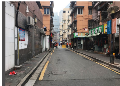
图 4 西白菜园路南侧街景