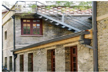
图 2 西白菜园的民国建筑细节