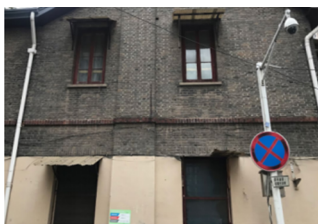
图 8 西白菜园的民国建筑色彩效果

西白菜园路老旧小区建筑外立面的色彩较为庞杂、随意,与风貌区民国建筑的外立面色彩差别较大,这对街道的整体感产生较大的干扰。因此,设计应依据周围民国建筑群的主要色彩(图 8),将建筑立面进行翻新粉刷,统一主体色彩为饱和度低的米黄色,使街道在色彩上保持和谐,具有视觉连续性。为了防止整体色彩过于单调、沉闷,部分建筑细部应辅以青灰色、深咖色等传统民国建筑色彩,在统一中寻求变化(图 9)。