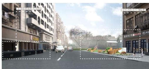
图7 西白菜园路街景设计