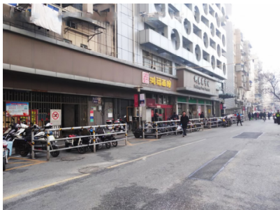
图 3 西白菜园路北侧街景

西白菜园街区的现状为:1)由于西白菜园地块内菜场和低端餐饮业的存在,道路地面、人行道等较为脏乱,局部存在破损。2)周边建筑大都为 20 世纪 80 年代的老旧小区,其建筑造型和色彩较为杂乱,与西白菜园的民国建筑风格不协调。3)建筑构件(如晾衣架、雨棚、空调机位及防盗窗等)凌乱不堪,多处存在违章建筑。4)垃圾箱等生活必备设施样式不一,地块内缺少路灯等生活设施,非机动车停放随意。这些均严重影响街区的形象(图 3—图 4),不能满足人们高品质的生活需求,因此西白菜园路的街道景观风貌急需更新修复。