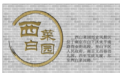
图6 西白菜园路路标的设计

街道更新应与历史街区的文化内涵紧密关联,让人们体验到生活情境中所含有的场所精神。场所精神反映了特定期人和场所间产生的方向感和认同感,其与物质遗存和传统社区的存续有着直接的关系,有助于人们更好地体验城市环境。西白菜园民国建筑的遗存及其历史文化背景为周围街道环境的更新提供了重要的参考价值,地下通道入口外立面的设计采用了民国店面牌坊和民国建筑弧形拱门的形式。此外,西白菜园路与科巷交接处设置了通向西白菜园的路标,路标设计采用了黄铜与青砖相结合的方式(图6),符合民国风情。在民国建筑群附近,禁止机动车违停,并清除了与环境不相容的设施,仅设置简洁栏杆,避免视线阻碍,以保证人们能在西白菜园路最大限度地观赏民国建筑群(图7)。