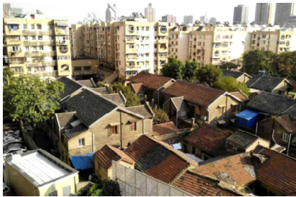
图 1 西白菜园的民国建筑鸟瞰

2019年,南京市规划和自然资源局公布西白菜园民国建筑风貌区的修建详规,拟把西白菜园打造成以文化展览、老字号商业、文创休闲为一体的民国历史文化休闲街区。由于西白菜园处在深巷,交通可达性较弱,再加上周边建筑形态混乱及违建情况严重,为历史街区风貌的重塑增加了一定的难度。西白菜园路街道更新的原则为:1)在更新设计中最大限度地展现历史传统风貌;2)将周围不同年代建造的建筑与历史街区的风貌相协调,进行整体风貌景观修复。