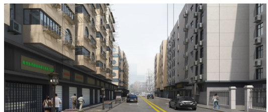
图 9 西白菜园的建筑轮廓与色彩更新